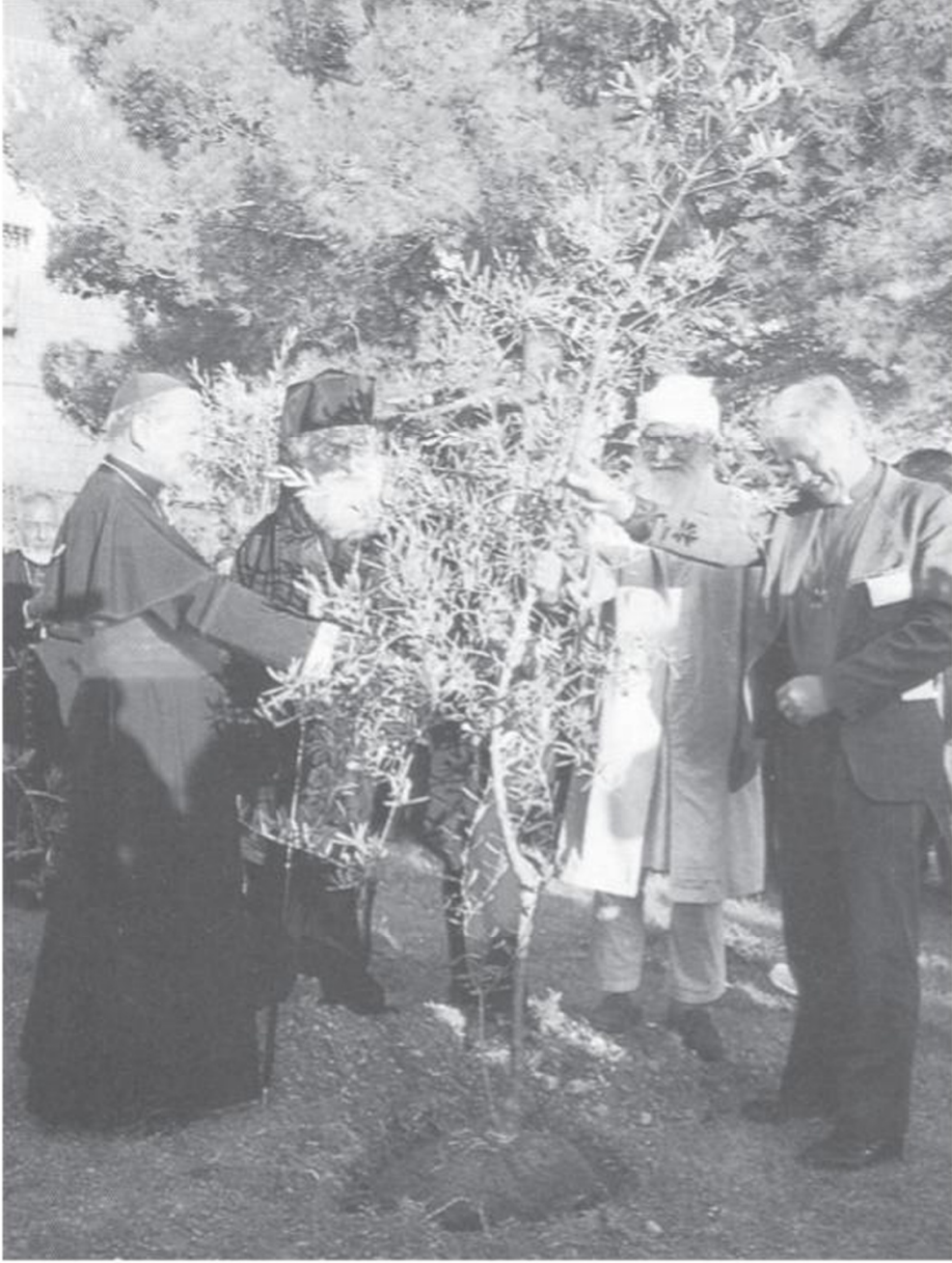
ఎడమ నుండి మూడవ వ్యక్తి మౌలానా వహీదుద్దీన్ ఖాన్ గారు. 1995లో జెరూసలేంలో ఏర్పాటు చేసిన ప్రపంచ మతాల శాంతి సమ్మేళనంలో పాల్గొన్న సందర్భంగా ఒక ఓలీవ్ మొక్కను నాటుతున్నారు.